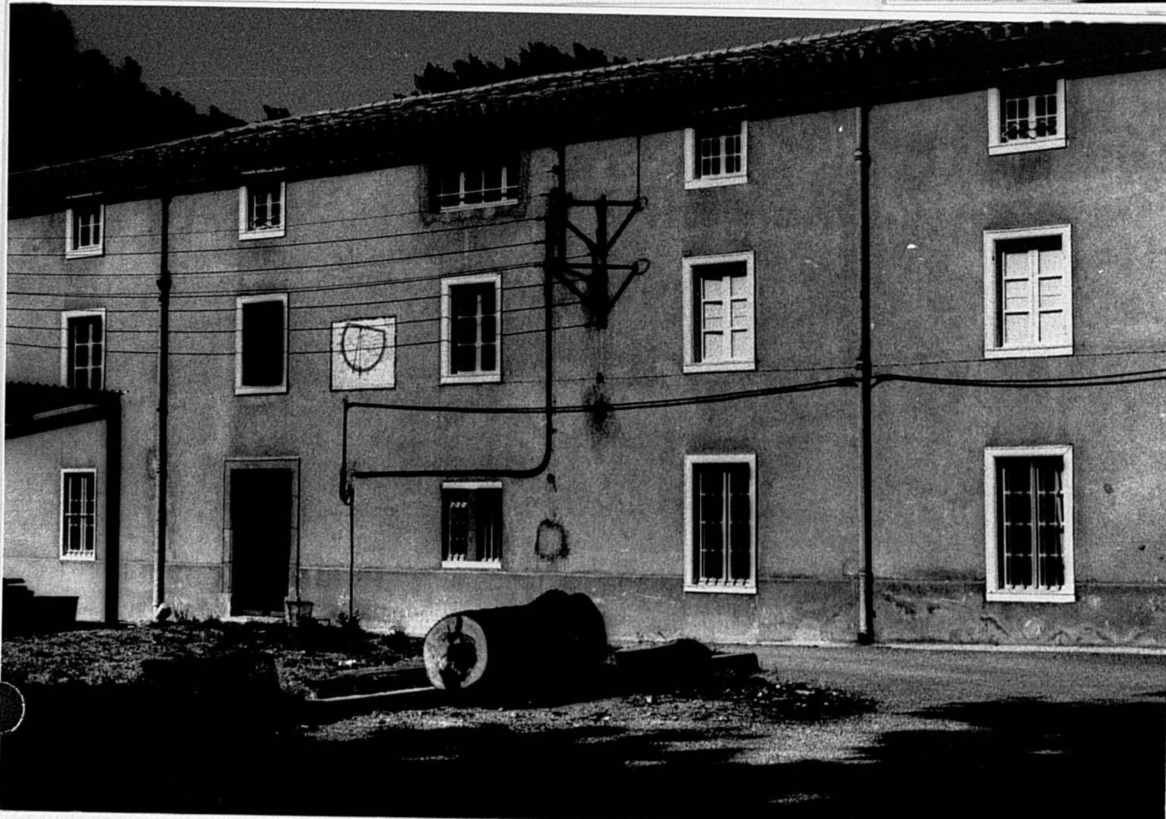
85 11 II 7 Maison du maître Façade postérieure